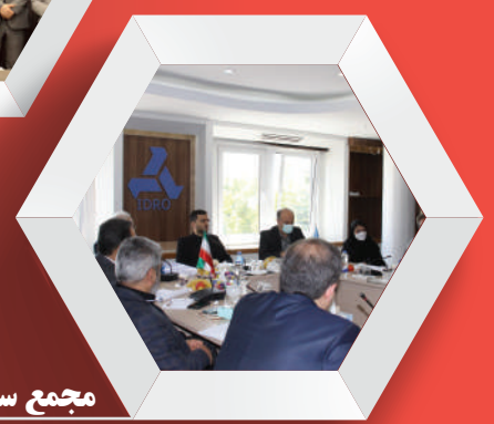
مجمع سالانه مگفا