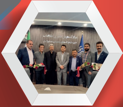
تجلیل از اینثارگران