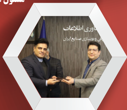
جلسه شورا مدیران و انتصاب سرپرست روابط عمومی