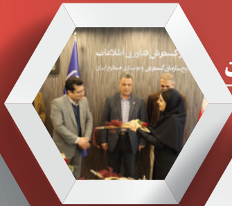
مراسم تولد بهمن