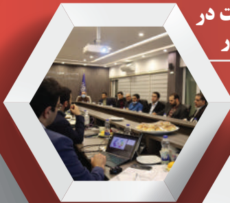
جلسه با معاون وزیر صمت در امور هماهنگی و امور کسب و کار