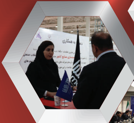
چهارمین نمایشگاه تقاضا ساخت تولید ایرانی