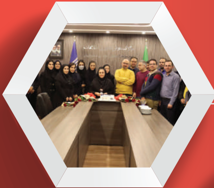
مراسم تولد دی