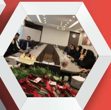
مراسم تولد اسفند