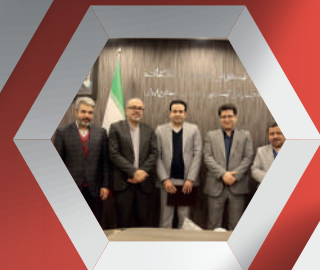
تقدیر از مدیران برتر