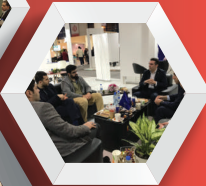
نمایشگاه شهر پایدار کیش